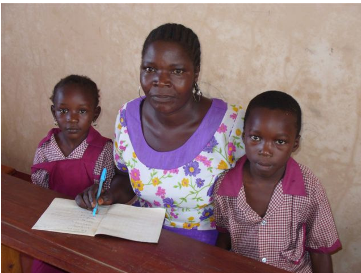
La maestra Consolata mandata a studiare per preparare le altre maestre